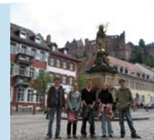
“Convention Heidelberg 2007”

Den Deutsch-amerikanischen Tag, an dem die Lucius Clay Medaille an Persönlichkeiten verliehen wird, die die Freundschaft zwischen Deutschland und Amerika in besonderem Maße gefördert haben.