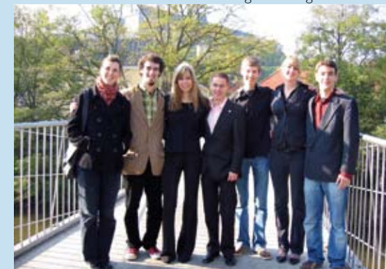
“DA-Tag Bamberg 2007”