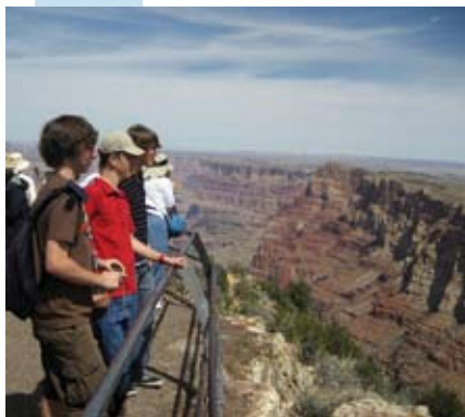
“Am Grand Canyon”

My experience in the VDAC Homestay Germany Program this summer was very memorable. Although I have travelled to Germany before, this trip gave me a new outlook on German culture. It was very rewarding to stay with a German family and experience first-hand their life on a day-to-day basis. Visiting different cities in Germany allowed me to experience the unique aspects of each destination. Participating in the program allowed me to learn a great deal about culture. I am very glad I took this opportunity because the experiences I gained are crucial for having a successful future.